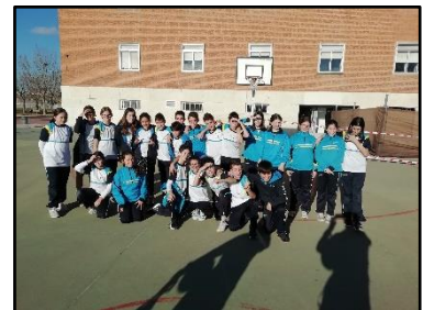
Participantes de baloncesto en la tarde deportiva Chaminade, 5º y 6º